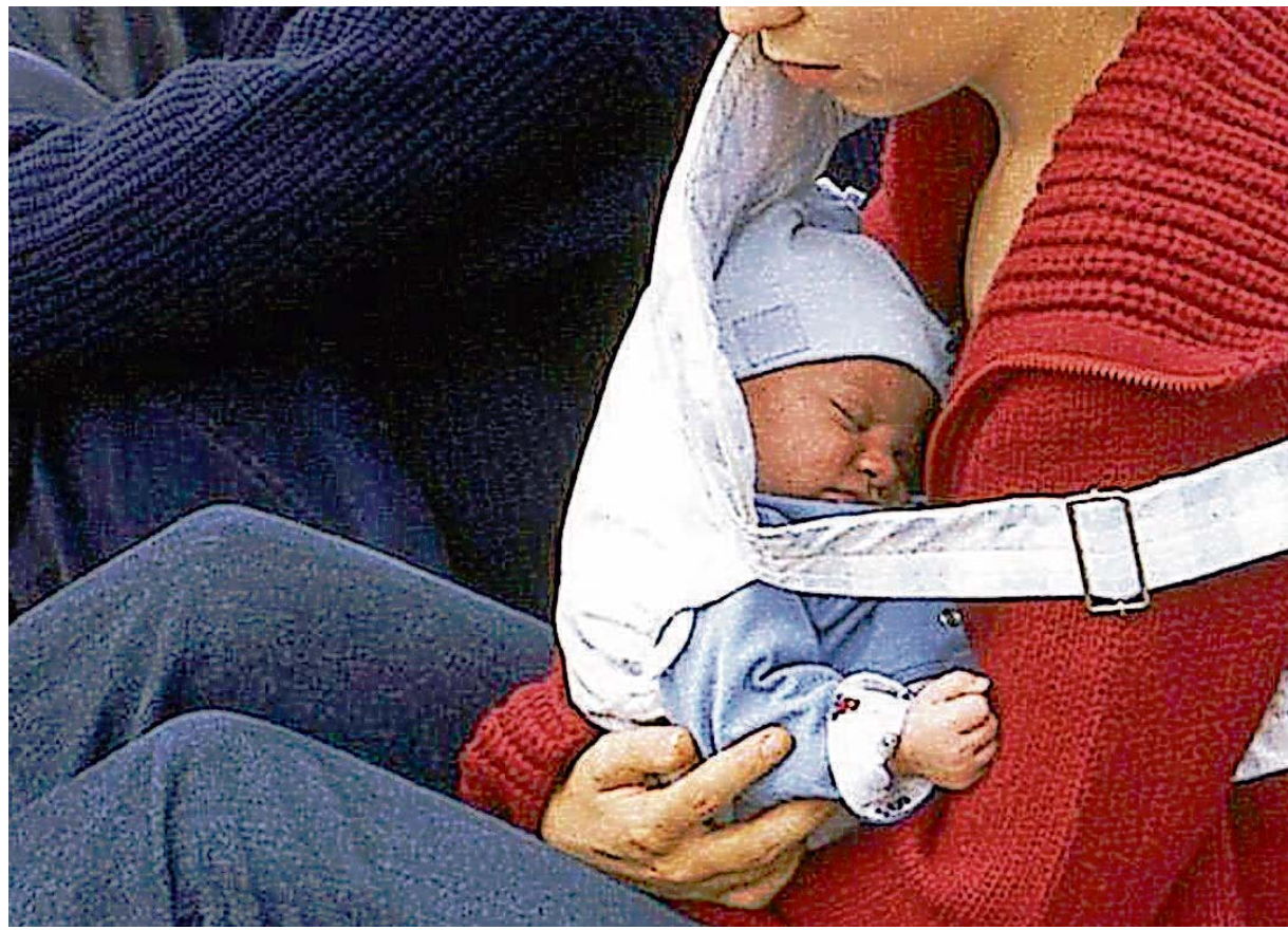
Mutter, ohne selbst erwachsen zu sein? Problemkinder bekommen oft zu früh eigene Kinder.

Die Mädchen in Mutter-Kind-Einrichtungen stellen nach Schätzungen von Experten die Minderheit der Teenagemütter. Die meisten kommen aus geordneten Verhältnissen, leben dort mit ihrem Kind. Derweil dienen Mutter-Kind-Einrichtungen als Nachhol-Trainingslager für Mädchen, die nie gelernt haben, regelmäßig zu essen, die Kinderlieder nur aus dem Fernsehen kennen und denen es fremd ist, zuerst zu sparen, bevor etwas gekauft wird. Viele sind hoch verschuldet. 6000 Euro zahlt das Jugendamt für jede von ihnen. Für die Lebenshaltung haben die Mütter zusätzlich