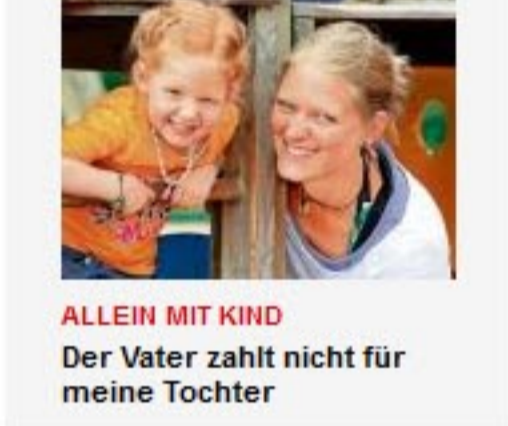
ALLEIN MIT KIND Der Vater zahlt nicht für meine Tochter