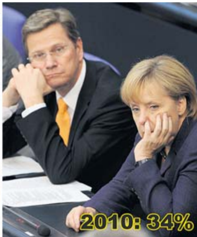
Zwischen den Werten liegen Welten: Zwei Jahre nach der Wiedervereinigung konnten sich Helmut Kohl (CDU) und Hans-Dietrich Genscher (FDP) über breite Zustimmung freuen, während nun Angela Merkel (CDU) und Guido Westerwelle (FDP) im Umfragekeller sind.