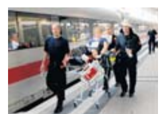
Einige Fahrgäste wurden in Kliniken gebracht.

Bahnchef Grube und Bundesverkehrsminister Peter Ramsauer (CSU) wollen heute Mitglieder des Bundestags-Verkehrsausschusses über Ursachen und Folgen der Pannenserie informieren. Betroffene Fahrgäste hatten auch das Verhalten einiger Bahnmitar-